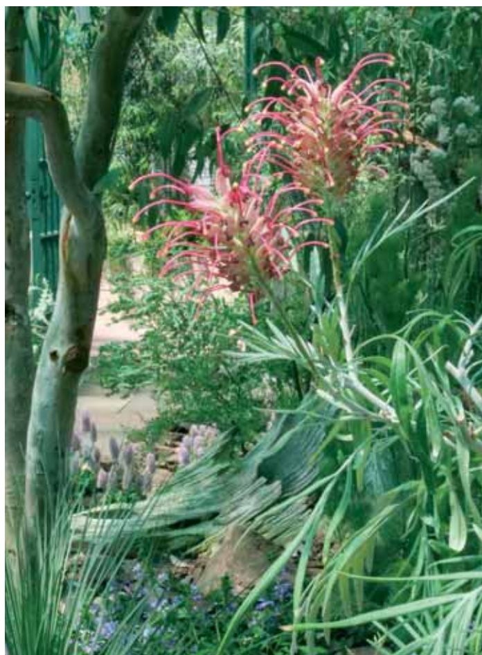
Die rotblühende Silbereiche macht ihrem Namen alle Ehre.

In Kooperation mit den Zoologen sind in der Botanikschau auch ausgewählte Tiere aus diesen Regionen in Terrarien ausgestellt. So lässt sich die plüschig-behaarte Rote Chile-Vogelspinne problemlos aus nächster Nähe beobachten. Um die als welke Blätter bestens getarnten Gespenstschrecken in den Zweigen zu entdecken, braucht man allerdings einen scharfen Blick und eine Portion Geduld.