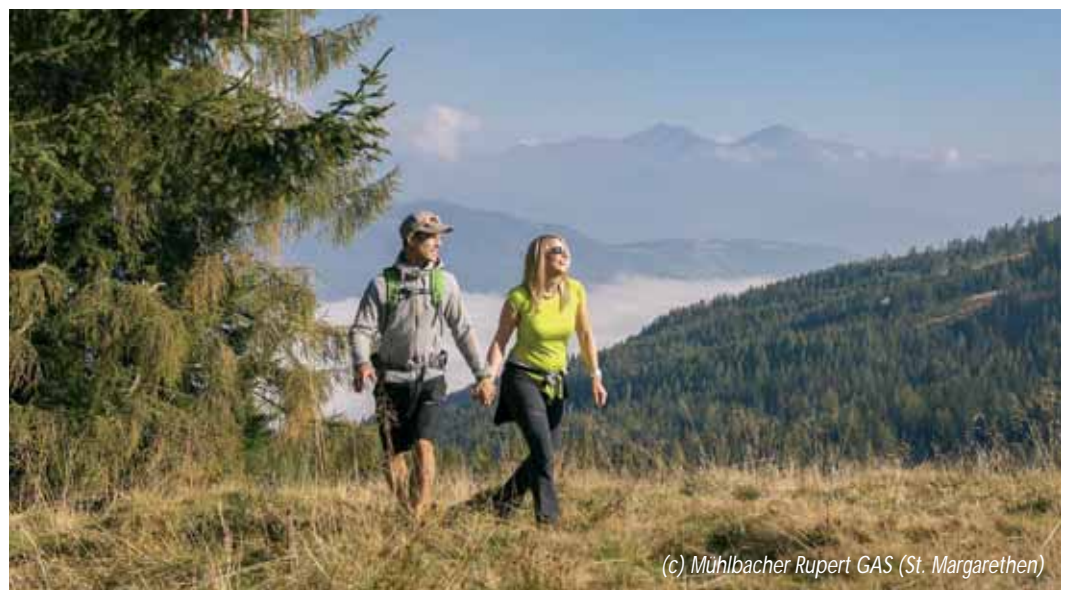
(c) Mühlbacher Rupert GAS (St. Margarethen)