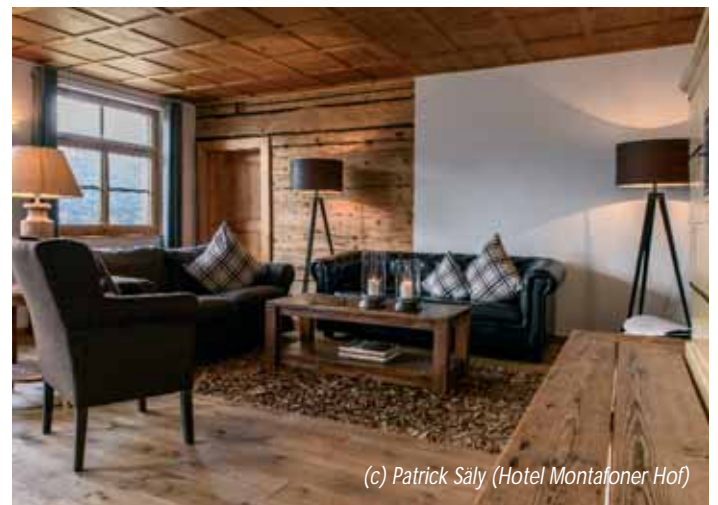
(c) Patrick Saly (Hotel Montafoner Hof)